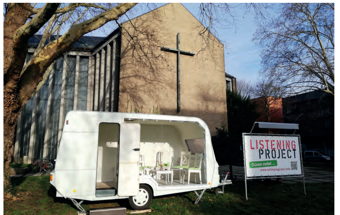
Wohnwagen vor der Kirche