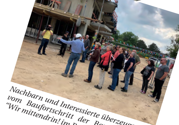
Nachbarn und Interessierte überzeugen sich vom Baufortschritt der Baugemeinschaft „Wir mittendrin! im PrymPark“, FOTO: LISA PALM