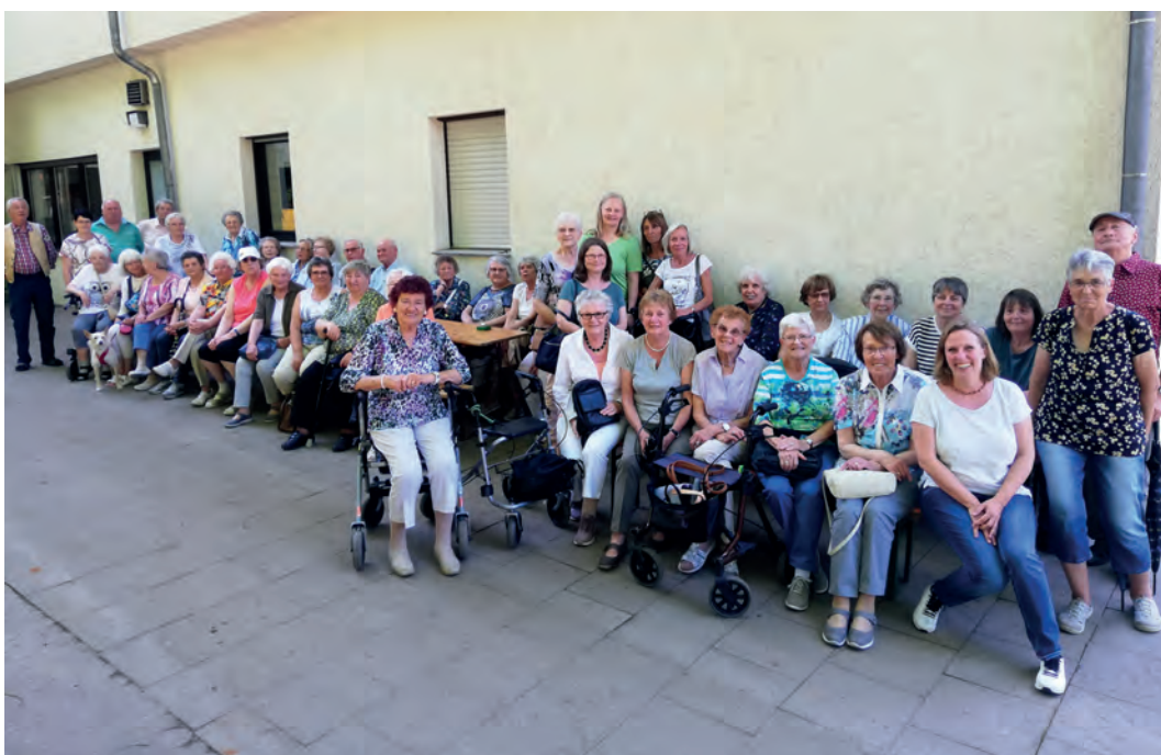
4 Seniorengruppen, 4 Pfarrerrinnen und ein Hund