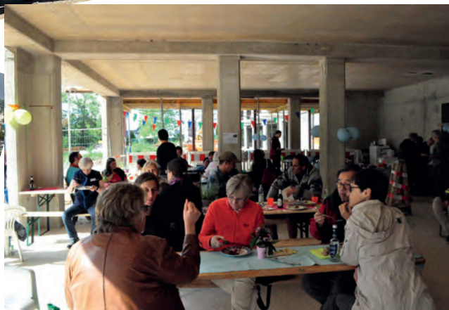
Zusammen essen und reden im Rohbau des größten Gemeinschaftsraumes der Siedlung