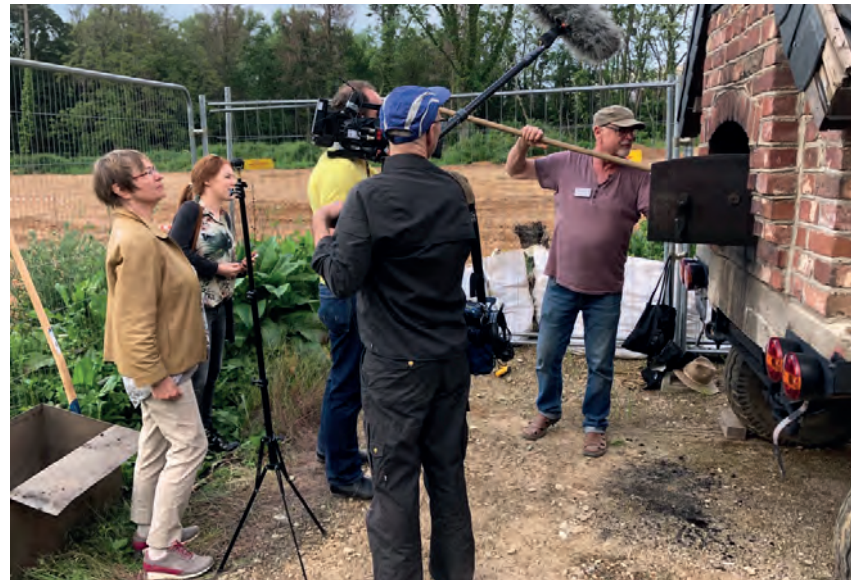
Steinbackofen der PrymPark-Siedlung mit neugierigem WDR-Filmteam